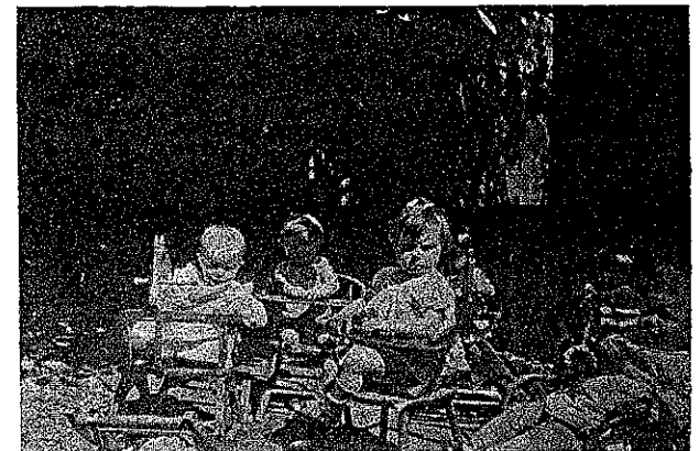
IN DEN STOEL