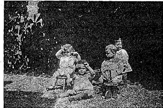
AAN HET SPELEN

Met groote waardeering wordt hier ook de naam genoemd van Prof. Dr. Cornelia de Lange, die een